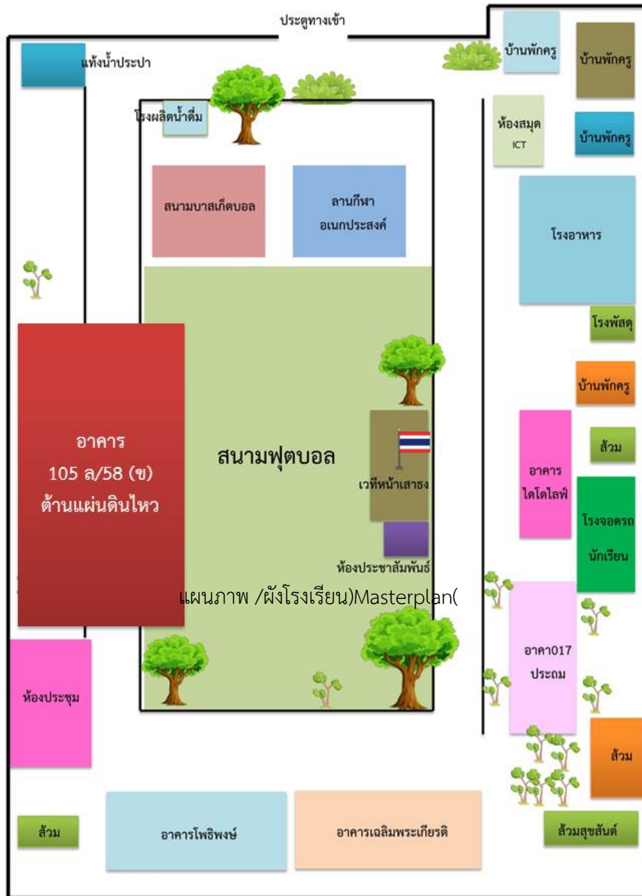
แผนภาพ /ผังโรงเรียน)Masterplan(